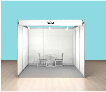
Stand ouvert sur 1 côté / Reihenstand / Row stand