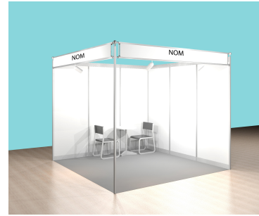
Stand ouvert sur 2 côtés / Eckstand / corner stand